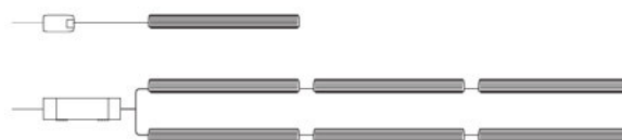
Diagrama de la instalación eléctrica