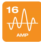
Se conecta a cualquier unidad o estación de carga de 16 A (trifásica) con una conexión de tipo 2.

Carga en casa y en movimiento Tipo 2 a Tipo 2 PIN | 3PHASE